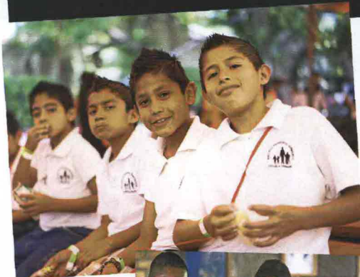
Alcuni degli orfani accolti nella Casa San Salvador dell'organizzazione umanitaria ong Nph a Miacatlán, in Messico.